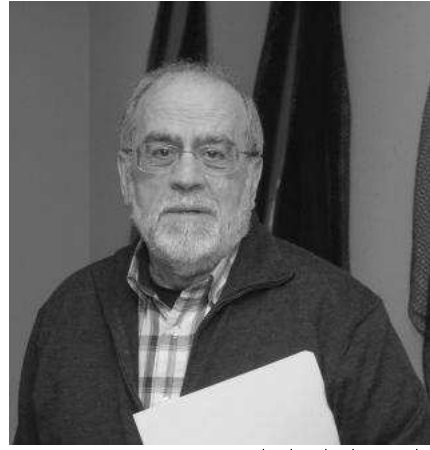
Lo absurdo o innecesario

Imaginemos que usted tiene un barco de pesca. Por el mero hecho de tenerlo, está obligado a llevar un botiquín para la atención del personal a bordo. Esta obligación nace en el Real Decreto 258/1999 que establece condiciones mínimas sobre la protección y asistencia médica a los trabajadores del mar e incorpora al ordenamiento jurídico español la Directiva 92/29 CEE del Consejo, de 31 de marzo de 1992. Tal decreto detalla la dotación de los botiquines según el tipo de barco.