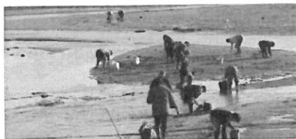
Mariscadoras a pie de Vilanova.