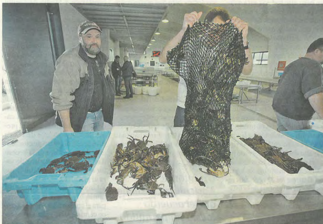
En la lonja de Vilanova fue donde la nécora alcanzó las mejores cotizaciones de la campaña. MÓNICA IRAGO

La impresión de Fernández la corroboran desde la lonja ribeirense, donde apuntan que este no ha sido un buen año de nécora, aunque sí han subido los precios.