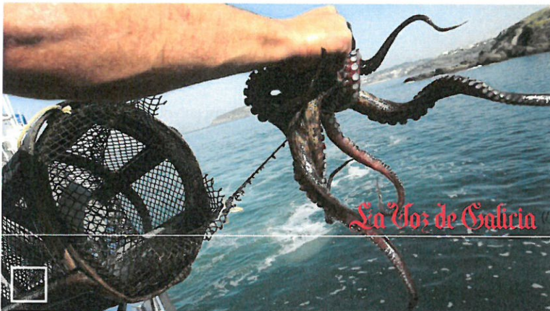
VITOR MEJUTO (/FIRMAS/VITOR-MEJUTO).